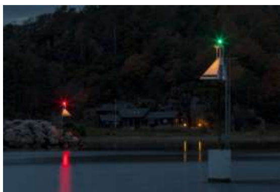
Dirigens LUX – Nattestid

Dirigens Lux er en lanterne med indirekte belysning utviklet av Kystverket. Navigasjonsinstallasjonen er tilpasset nærnavigasjon, og gir primært en ytterkants markering av seilingskorridor ved natt- og dagseilas. Bakenforliggende område er å anse som urent farvann.