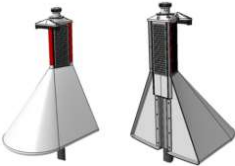
Dirigens LUX – 3D modell