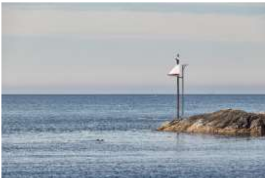
Dirigens LUX – Dagtid