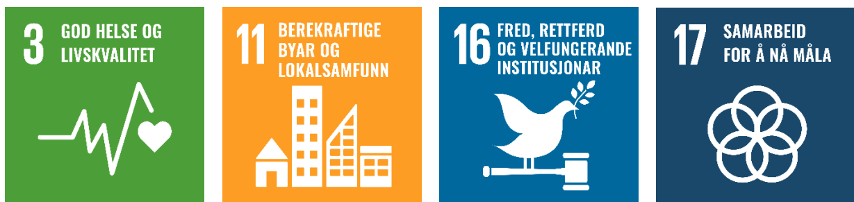
Figur 1 Dei av FNs berekraftsmål som hovudmåla i planen er tufta på.

Kommunedelplan for fysisk aktivitet, idrett og friluftsliv hentar mål og strategiar frå kommunen sin samfunnsplan. Grunnleggande for alle måla er FNs berekraftsmål. Dei fire berekraftsmåla som hovudmåla i plan for fysisk aktivitet, idrett og friluftsliv er bygd på er vist i Figur 1.