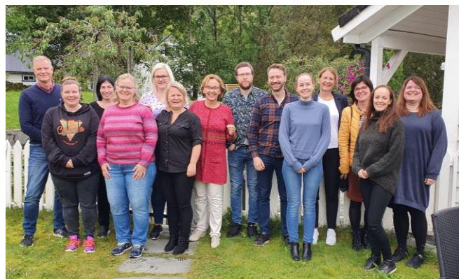
Bilete frå felles samling på Osterøy.

Vi gler oss til vidare utvikling for å gje best mogleg tilbod til innbyggjarane våre.